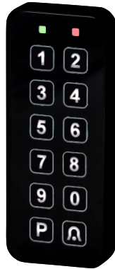
CTKL - SW