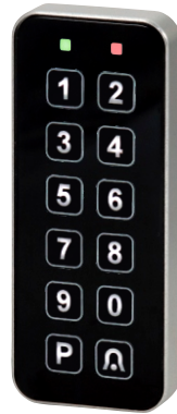
CTKL - S

Touch - Tastenfeld Hintergrundbeleuchtung 2 Draht / max. 100m / IP 67