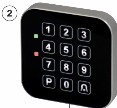
CTK - S