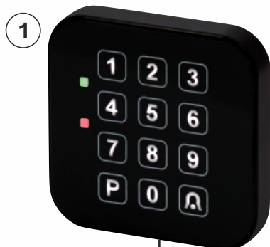
CTK - SW

Entrée : code programmable de max 8 chiffres